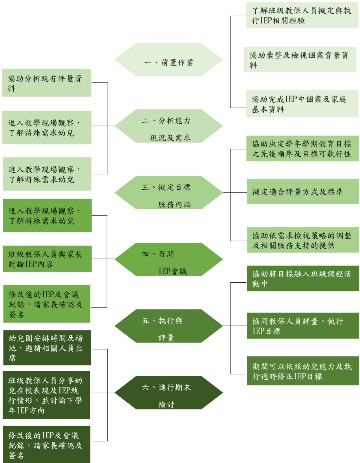
圖 3 巡輔教師參與訂定 IEP 的流程

蔡昆瀛 (2020)。嘉義縣學前融合教育課程調整暨巡迴輔導實務增能計畫。教育部國民及學前教育署委託。